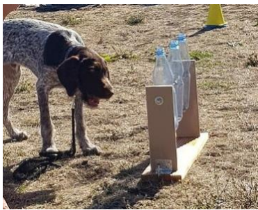
Flaschendreher für Hunde????