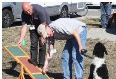
dahinten ist es viel interessanter und ..... zu zweit locken ist unfair.....