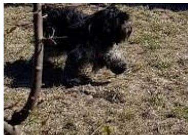
6 Hunde ????