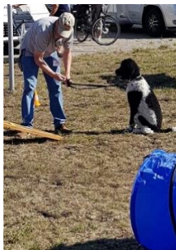
da drauf? Ich auch?