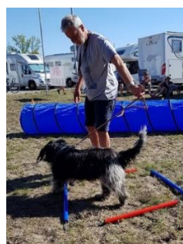
du blickst in die falsche Richtung.....