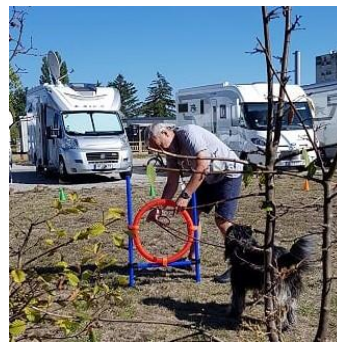
ich nehme Anlauf dann .....