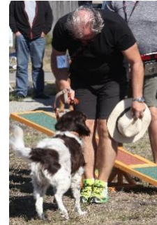
Haltung muss sein.....