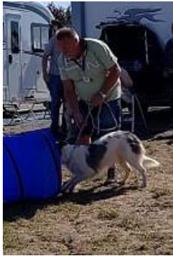
nun mach mich schon los.... am Ende steht Frauchen mit Leckerli ..