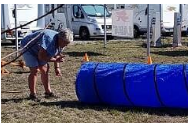
gleich bist du am Ziel...