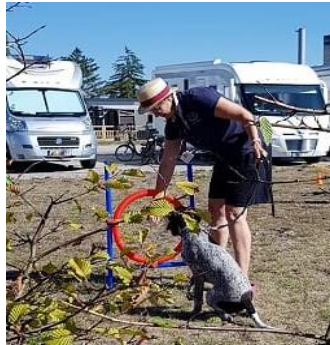
????? ich auch?????