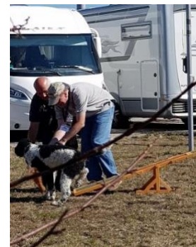
...und festhalten auch..... aber sehr interessant dahinten .....