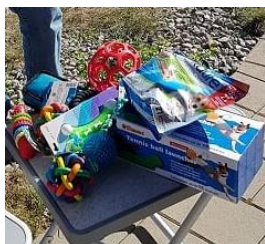
Preise zum Ausschuchen

Die anschließende Preisverleihung gestaltete sich etwas schwierig. Da die Hunde alle Aufgaben mit Bravour gemeistert hatten wurde nach dem Alter der Hunde bewertet. So bekam das jüngste Tier den 1. Preis usw.