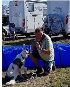
pass auf .....nächste Aufgabe ....