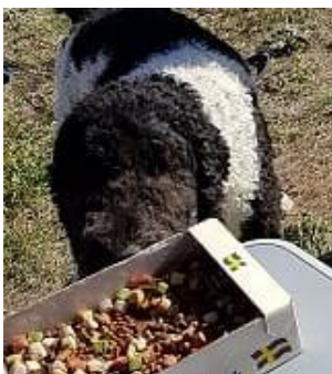
Preise ?? ..... d a a sind ja die Lekkerli...