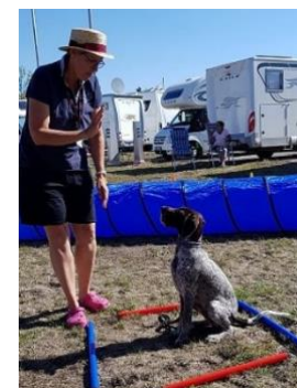
mir egal.... Ich bin jung...hab nur Augen für mein Frauchen.....