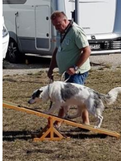
wer war vor mir drauf?