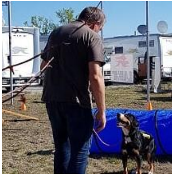
also... durch die Röhre...