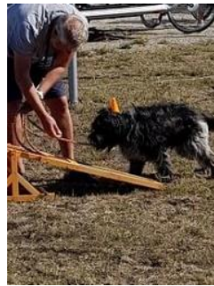
erst die Belohnung, dann.....