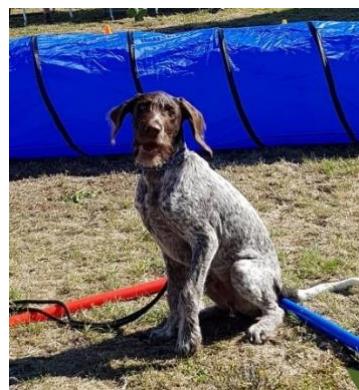
sooo sieht der SIEGER aus!