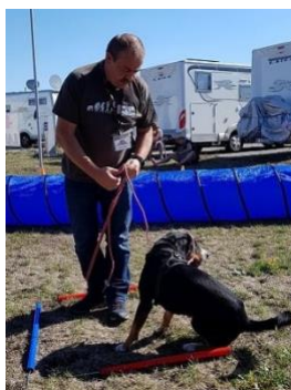
interessant? wo? ich sehe nichts.....