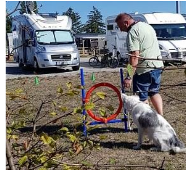
?????? hier durch ???